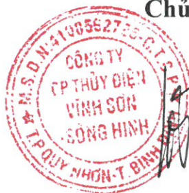
Võ Thành Trung